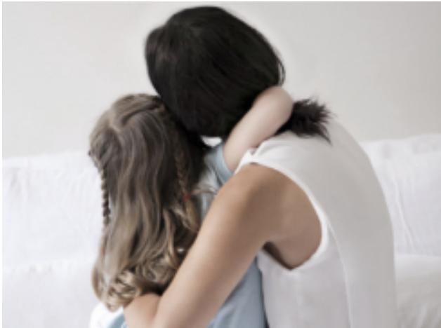
Adopté a una niña con VIH

( http://www.paula.cl/reportajes-y-entrevistas/los-descargos-de-paula-walker/ )